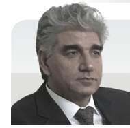
Dr. Munîb Ehmad

Bi Kurdî: Dendevrîş. Bi Latînî: Ammi visnaga. Bi Rûsî: Амми зубная. Bi Erebi: خلة بلدية. Bi Ingilîzî: Visnaga daucoides. Welatê Dendevrîşê Rojhilata Navîne û derdora Deriya Sipî û Kafkasê ye. Giyakî dû salane ye ta 1Mitrê dirêj dibe kulîlka wê wekû Siwanê ye rengê kulîlka wê sipî ye. Pêkhatiya kimawî :Forankrmon (Kêlîn, Visnagîn )û pîrokûmarîn visnadin û Flavonoîd pêkhatiyên Dendevrîşê ne lê Kêlîn pêkhata herî girînge û rêja kêlîn dighê ta 2,5 ji tevaiya Dendevrîşê pîraniya vê kerese di Navikê de ye ,piştî kû kulîlk hişk dibê .Beşê kû weke derman ji Dendevrîşê tê bikaranin Navika(Tov),ya kû di serê kulîlka wê de cih digrê Şewayê Tov hûre bibihneke taîbete û tama wê tahle û gezoyeJi Bizrê Dendevrîşê Dermanek he ye bi navê Xêlîn (khilin) ji bo ji navbirina Zixura di Gûrçikê de her weha gelek başe ji bo Qolinc û êşa kû dihinava çê dibê ,Qifara Dendevrîşê bi keskaî tê xwarin.